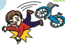
自転車で転んでのケガ