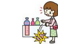
買い物中過って商品を壊した