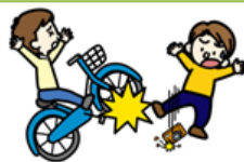
自転車にはねられてのケガ