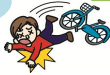
自転車で転んでのケガ