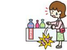
買い物中過って商品を壊した