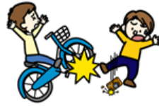
自転車にはねられてのケガ