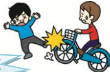
自転車で通行人にけがをさせた